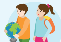
Học sinh lớp 1

Giá trị sử dụng bắt đầu từ ngày 01/10 năm đầu tiên của cấp tiểu học.