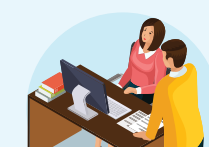
HSSV của cơ sở giáo dục, cơ sở giáo dục nghề nghiệp

Giá trị sử dụng bắt đầu từ ngày 01/10 năm đầu tiên của cấp tiểu học.