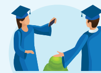
Học sinh lớp 12

Thẻ BHYT có giá trị sử dụng đến hết ngày 30/9 của năm đó.